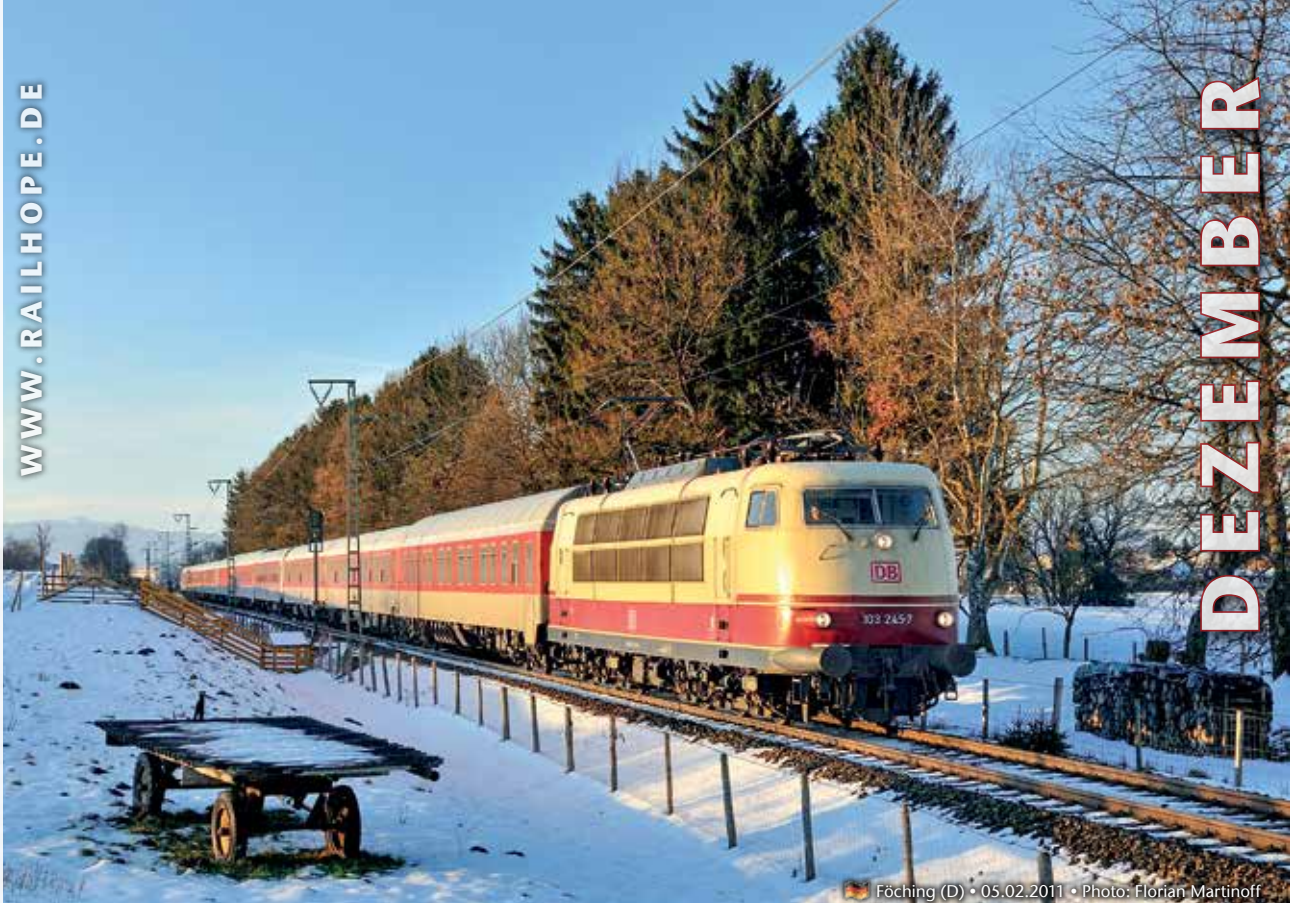
Föching (D) • 05.02.2011 •