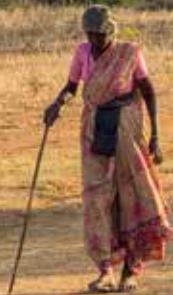
Thondebhavi (IND) • 30.12.2014 •