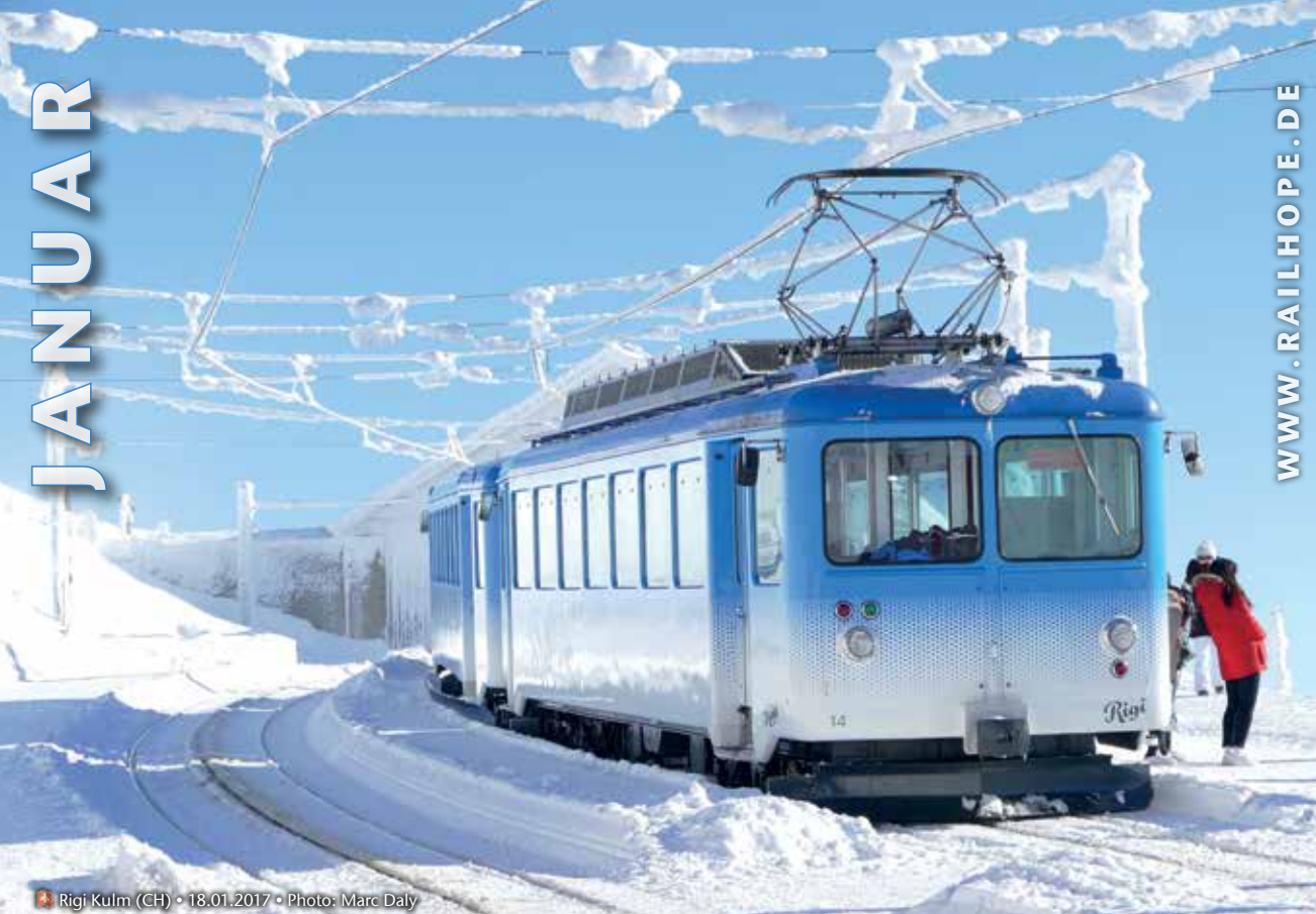
📍 Rigi Kulm (CH) • 18.01.2017 •