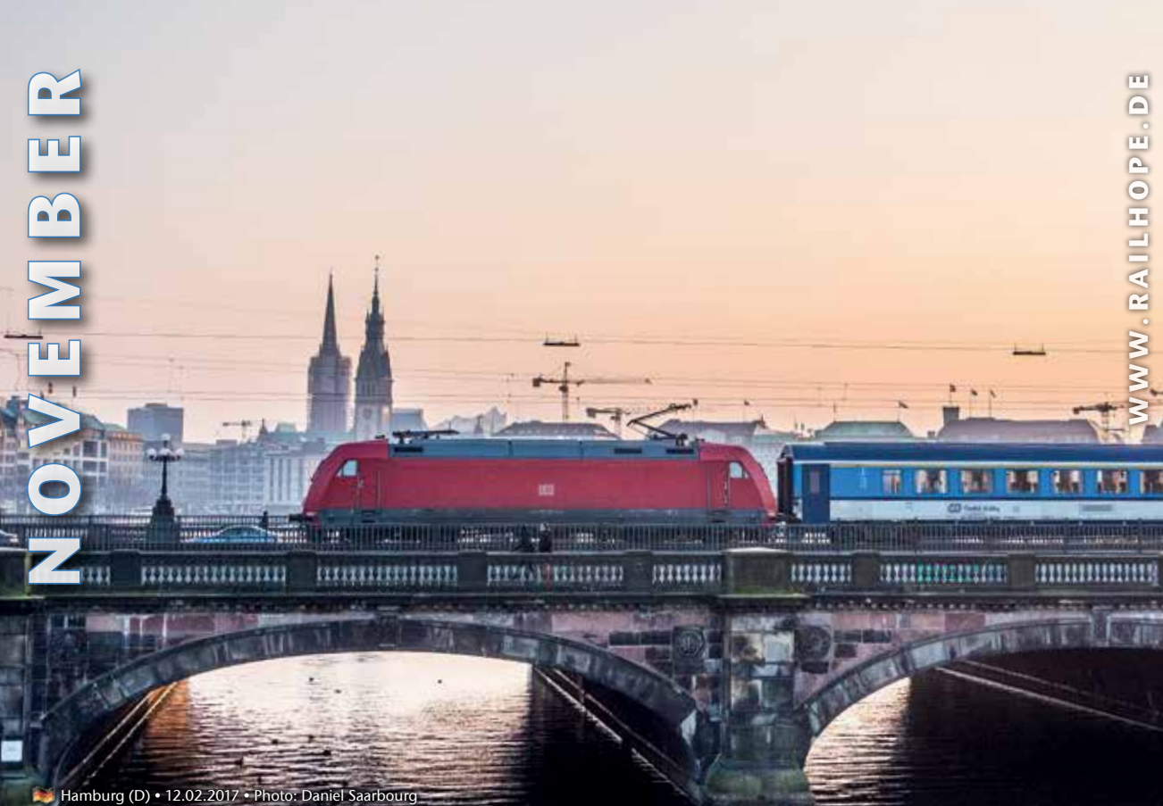
Hamburg (D) • 12.02.2017 •

1 2 3 4 5 6 7 8 9 10 11 12 13 14 15 16 17 18 19 20 21 22 23 24 25 26 27 28 29 30 DO FR SA SO MO DI MI DO FR SA SO MO DI MI DO FR SA SO MO DI MI DO FR SA SO MO DI MI DO FR